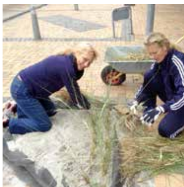
Marehalm på Odelsgade.