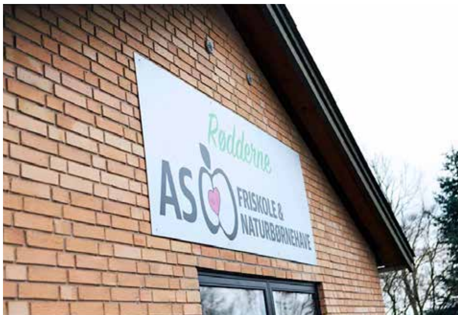
As Friskole og Naturbørnehave.