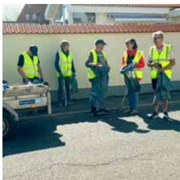
Juelsminde Green Team

Her er nogle eksempler på projekter og initiativer, som er initieret af Juelsminde Visionsråd og er blevet realiseret takket være frivillige borgere, sponsorer og lokale foreninger.