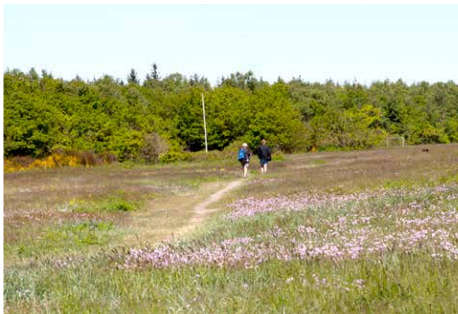
Bugten ved Juelsminde.