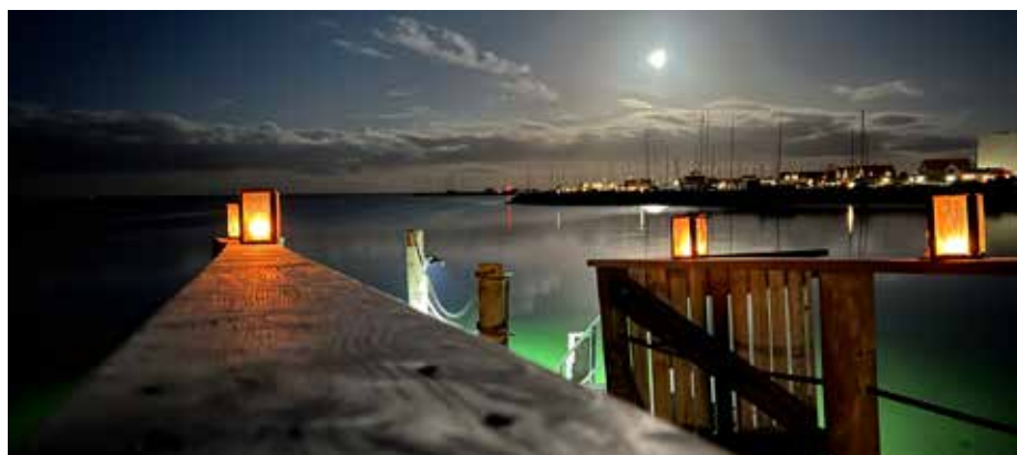
Fuldmånebadning hos Vinterbaderne i Juelsminde.