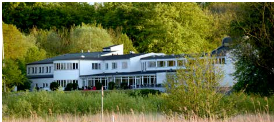
Hotel Juelsminde Strand.